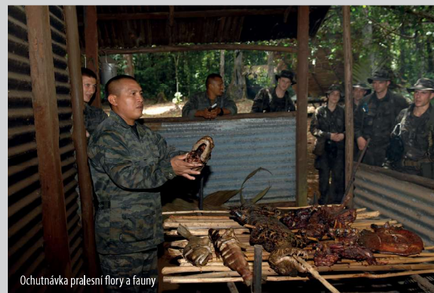
Ochutnávka pralesní flory a fauny

hodnocení. Musí vyrobit pasti na zvířata, lovecký posed, vykopat díru na odpady, či postavit vor pro zpáteční cestu přes řeku. Úplně prvním úkolem však bylo zbudovat si přístřešek. Jak uvádí četař H., neobešlo se to bez problémů: „Na místě nás vysadili až po obědě, zhruba kolem druhé hodiny, takže nebyl čas na vybudování přístřešků pro všechny, v našem případě tedy pro 22 lidí. Takže jsme zřídili jen jeden úkryt a museli jsme se tam na první noc vejít všichni. Až další den jsme stihli postavit druhý přístřešek, přístřešek pro oheň a to ostatní, co po nás instruktoři chtěli.“ A nároky měli instruktoři nemalé. Požadovali třeba, aby byl tábor označen cedulí s vyřezaným názvem příslušné jednotky. A jak uvádí rotmistr Z., to nebylo všechno: „Chtěli po nás, aby ten camp měl nějaký vzhled, takže v něm měly být zřízeny pěšinky. Ukázali nám rostlinu, která má fosforeskující lýko, a tou jsme si cestičky na noc značili.“