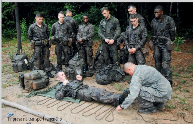
Příprava na transport raněného