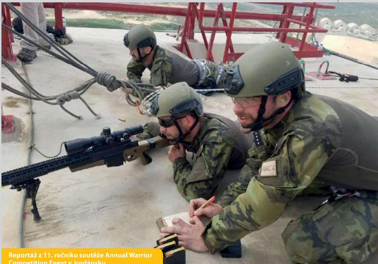
Reportáž z 11. ročníku soutěže Annual Warrior Competition Event v Jordánsku