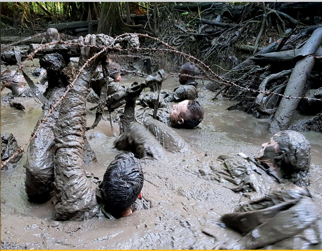
Zdolávání překážkové dráhy